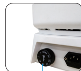
独立限温报警系统